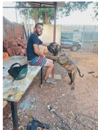
Ich und ein Fila Brasil 90Kg schwer