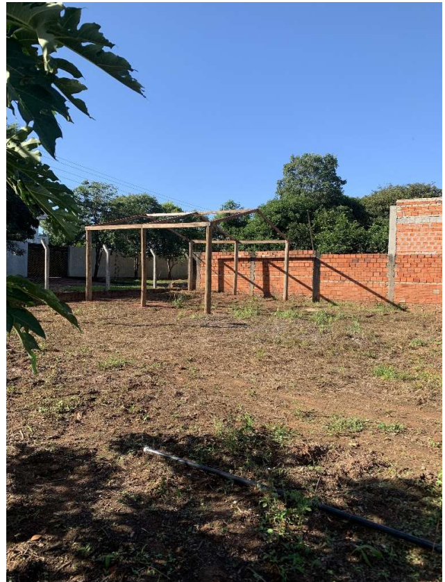
Gewächshaus die plane fehlt noch müsste demnächst kommen