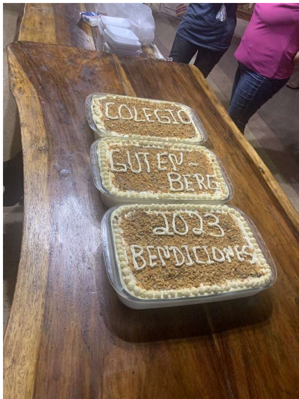
Feier für das neue Schuljahr ich meine es war Bienenstich Torte aus einer Deutschenkolonie „Friesland“