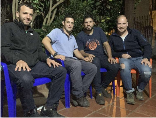
Ein Freund aus Deutschland und ich bei meinen einheimischen Amigos